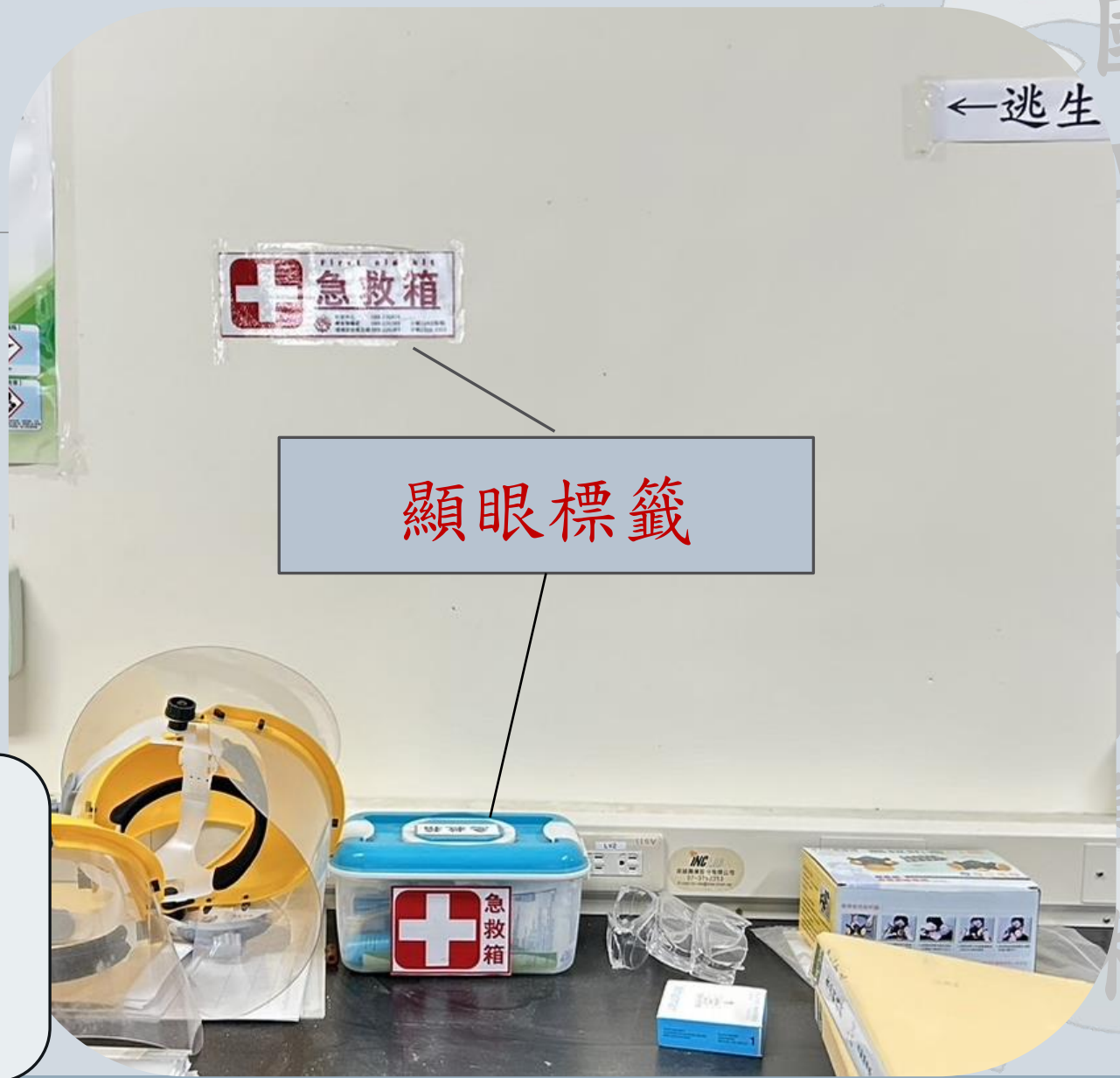
急救箱上張貼急救箱清單