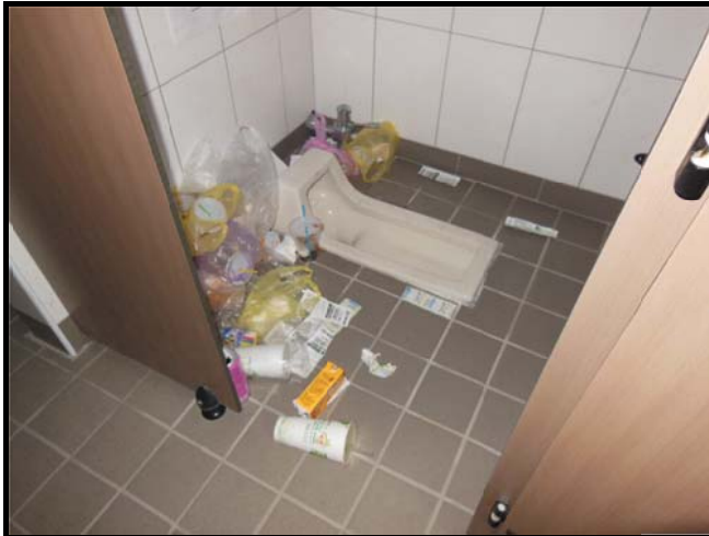
教學大樓 1 樓北面男廁未設置垃圾桶

臺東縣自 106 年 3 月 1 日開始實施透明垃圾袋政策，3 月 1 日至 6 月底為加強宣導期，期間未使用透明塑膠袋者，將提高破袋機率，且含資源回收物如在 3 件以上者實施退運，7 月 1 日起全面實施，未使用透明垃圾袋者將祭出罰鍰（1200～6000 元）。