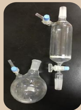
圖1.過濾器 and 玻璃瓶

A生於實驗室用硝酸清洗玻璃過濾器，未傾倒使用水及丙酮清洗，使硝酸及丙酮發生反應，導致玻璃瓶內因產生氣體壓力過大而裂開，使化學溶液噴濺至雙眼，欲使用緊急沖淋裝置，其距離超過20公尺且水壓不足。